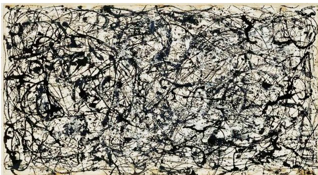
26A Black and white, 1948

Le peintre Pollock propose une émotion qui passe par le geste pictural et corporel.