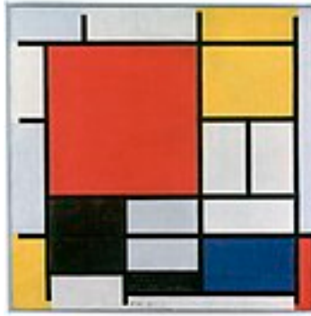
Composition en rouge, jaune, bleu et noir , 1921, huile sur toile, 59,5 × 59,5 cm, Gemeentemuseum.

Le peintre Mondrian propose une émotion qui passe par l'équilibre de la composition.