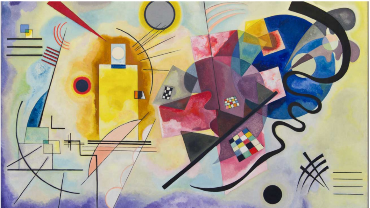
Vassily Kandinsky, Jaune-Rouge-Bleu , huile sur toile, 1925, Musée national d'art Moderne, Paris, France.

Le peintre Kandinsky propose une émotion qui passe par la couleur, le geste.